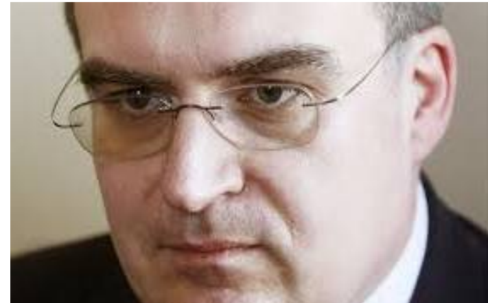
Zdeněk Žák, ministr dopravy ČR

Zdeněk Žák, propagátor ekologických forem dopravy před zahájením 11. Evropského dopravního kongresu