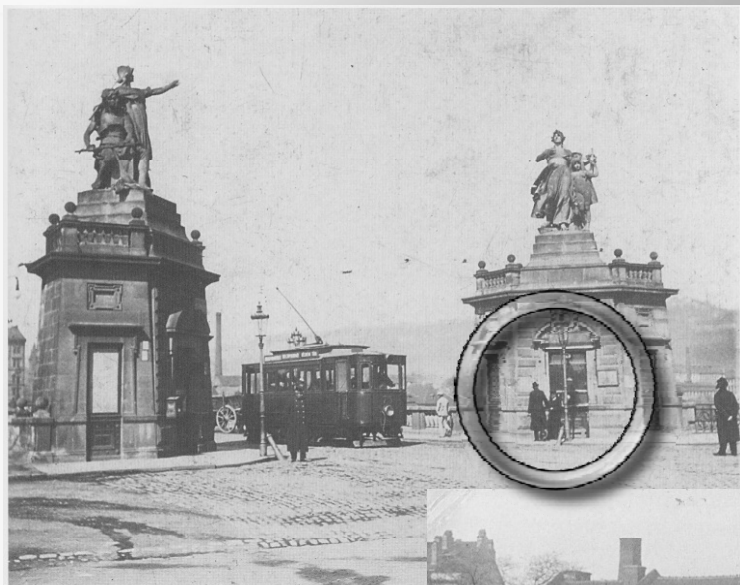
1901 Palackého most - mostné