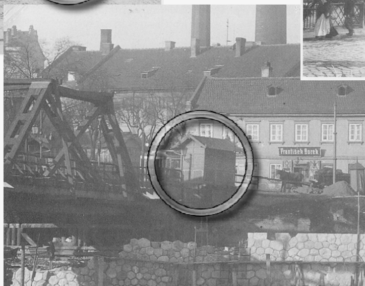
1909 – provizorní most mezi Holešovickými a ostrovem Štvanice - mostné