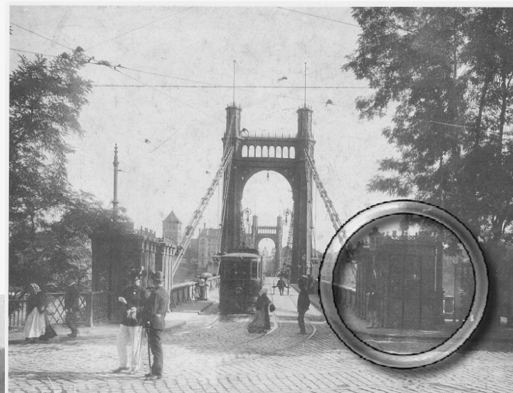
1907 - Holešovické předmostí mostu císaře Františka Josefa - mostné - potravinová daň