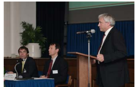
Slavnostní zahájení konference. Úvodní slovo rektora ČVUT Václava Havlíčka a místopředsedy Hospodářského výboru PS PČR Františka Laudáta.

Konference 6. České dopravní fórum byla realizována v kooperaci s Ministerstvem dopravy, ČVUT Praha, Státním fondem dopravní infrastruktury a dalšími oborovými institucemi; její odborný i společenský význam je zdůrazněn udělením těchto záštit: