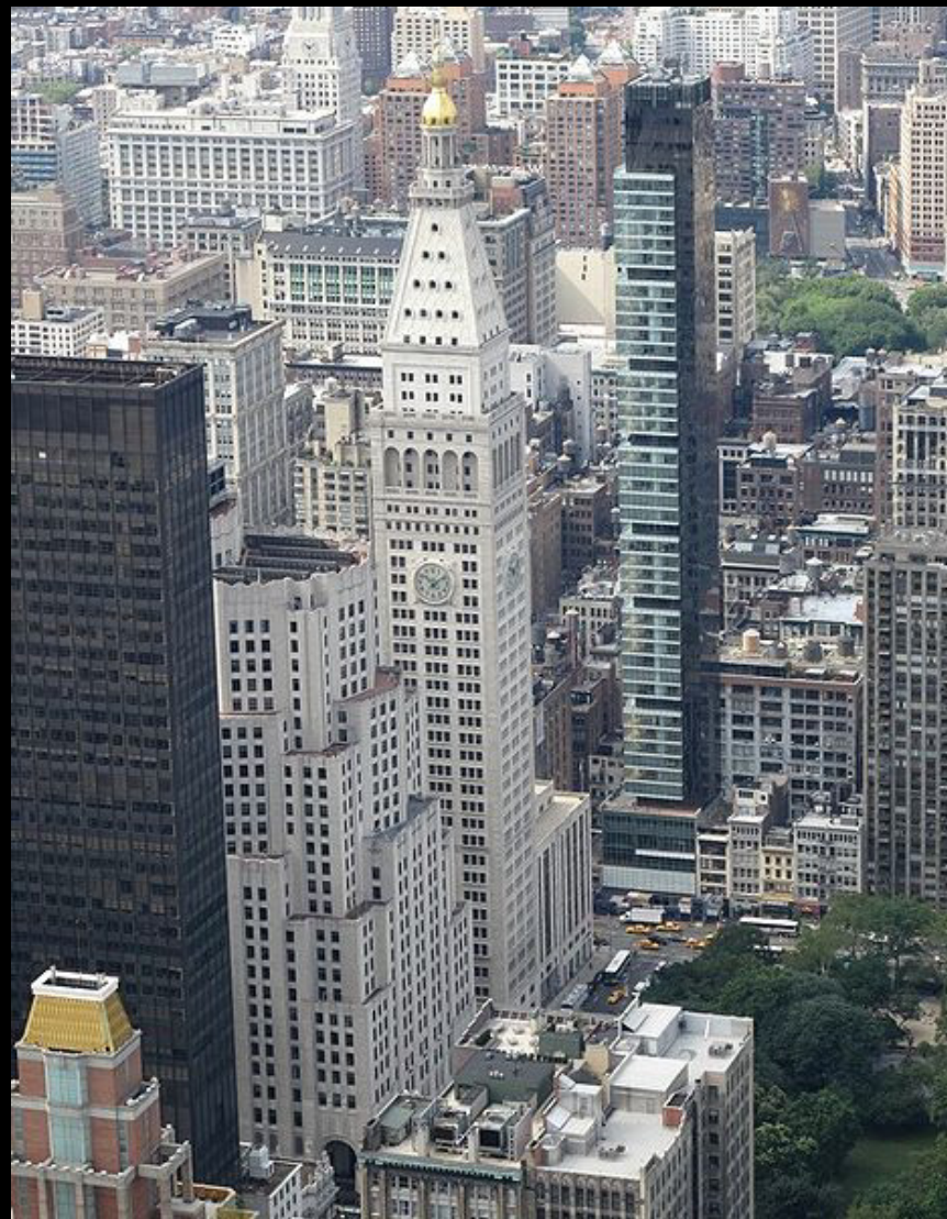
2010 - One Madison Park – Madison Square Park 50 pater 91 bytových jednotek (triplex za $ 45M)