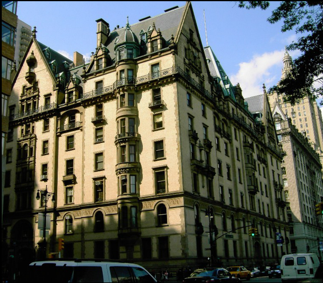
1880 – The Dakota– CPW and 72nd St.