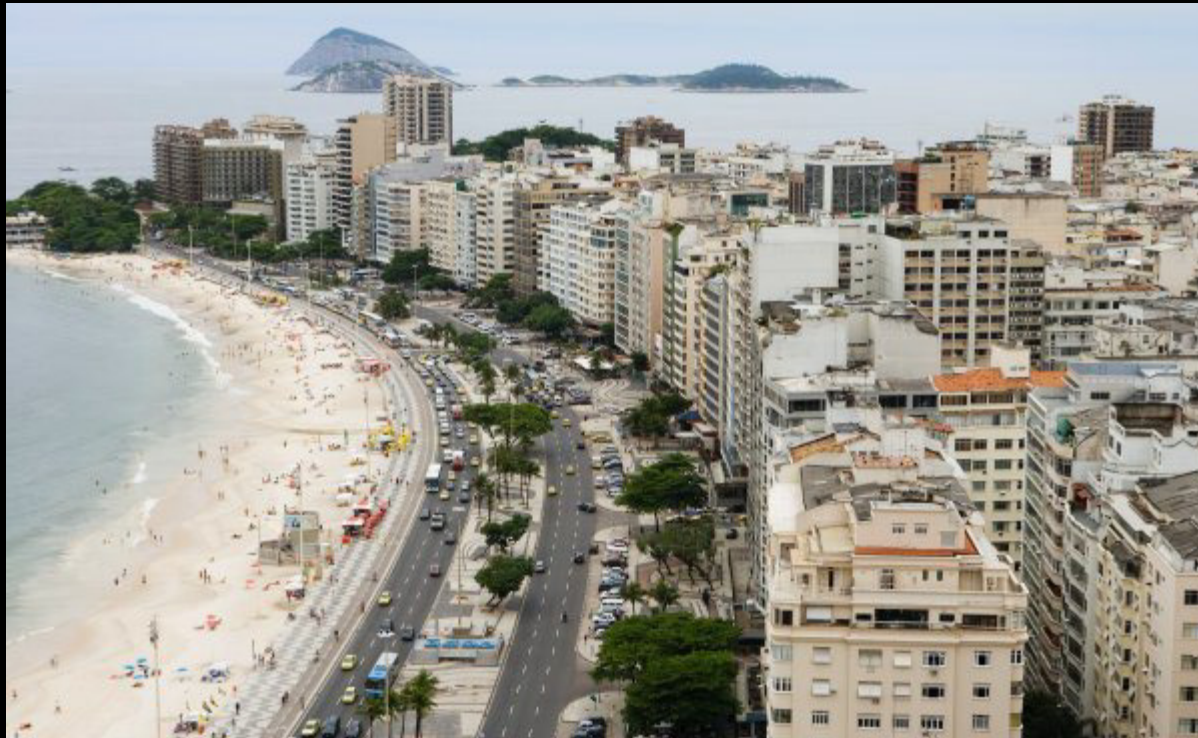
Copacabana – slabá zvuková izolace