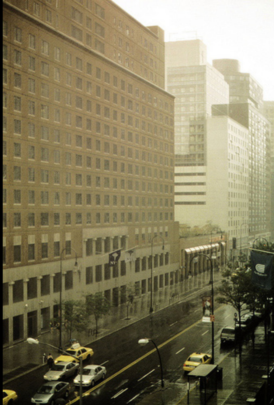
Studentské koleje NYU Palladium – E 14th