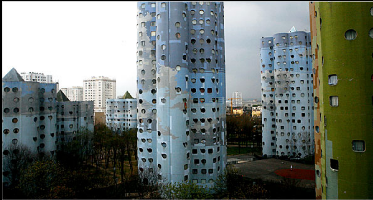
Nanterre, západně od Paříže