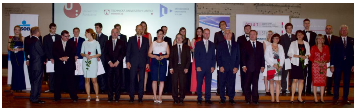
Fotografie vítězů ročníku 2015 s předávajícími – Betlémská kaple 16. 6. 2016