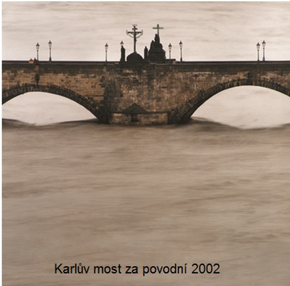
Karlův most za povodní 2002

Tradice celostátní soutěže vznikla v září roku 2002.