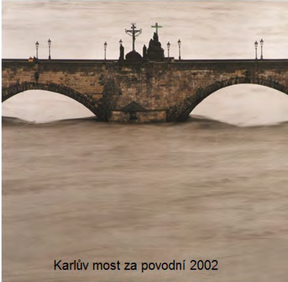
Karlův most za povodní 2002