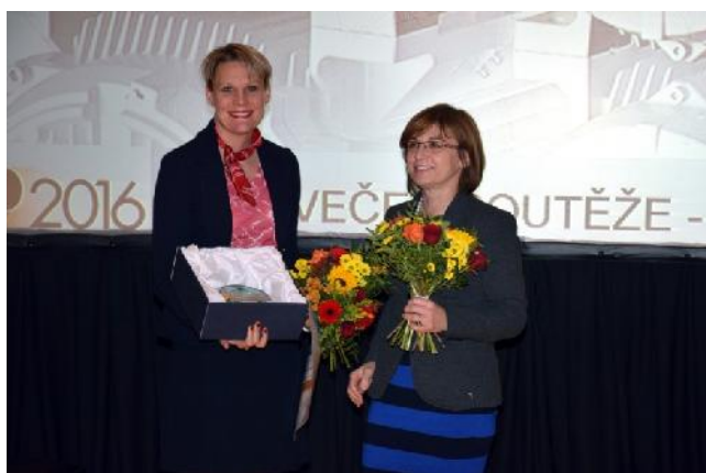
ABB Ability, PŘÍHLAŠOVATEL: ABB s.r.o.