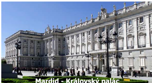
Madrid - Královský palác