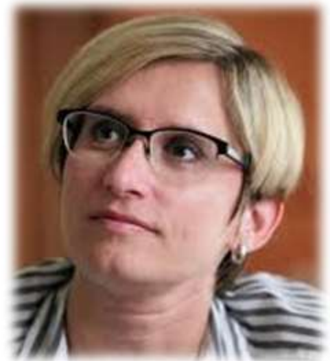
Ing. Karla Šlechtová ministerně pro místní rozvoj