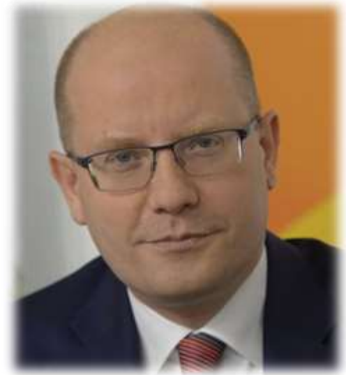
Mgr. Bohuslav Sobotka Premiér ČR

Jejím hlavním úkolem bude zajistit koordinaci agend spojených se čtvrtou průmyslovou revolucí, která přináší změny nejen v oblasti technologického rozvoje, ale rovněž i v dalších oblastech společnosti jako jsou trh práce nebo vzdělávání.