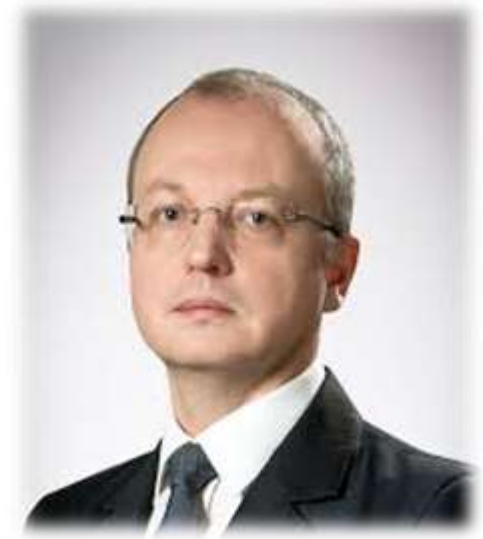
Ing. Eduard Muřický, náměstek ministra průmyslu a obchodu pro sekci PRŮMYSL

Průmysl 4.0 je třeba brát jako zásadní existenční výzvu k posílení konkurenceschopnosti českých podniků v evropském i světovém měřítku. Iniciativa podnikatelského sektoru je klíčová a pasivita se nebude vyplácet.