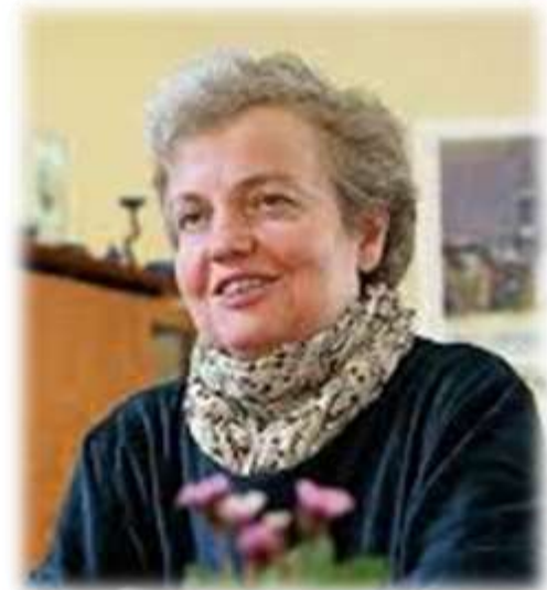
Ing. Dana Drábová předsedkyně Státního úřadu pro jadernou bezpečnost

Lepší, výkonnější a levnější baterie je jedna cesta k tomu, jak velmi zvýšit využitelný potenciál přerušovaných obnovitelných zdrojů.