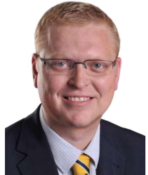
MVDr. Pavel Bělobrádek, Ph.D. Místopředseda vlády ČR ČR

výrazný nástup digitalizace a robotizace bude znamenat pro naše podniky velký tlak, na druhou stranu je také příležitostí. Šance Česka uspět je velká, protože naší výhodou je vysoká vzdělanost. Vláda připravila návrhy konkrétních opatření s cílem podpořit a motivovat podnikovou sféru, které stát musí v blízké době realizovat právě pro to, aby nám „vlak INDUSTRY 4.0 neujel“.