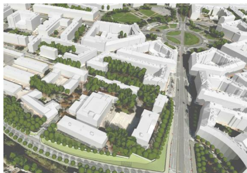
Praha jako Trafalgar?