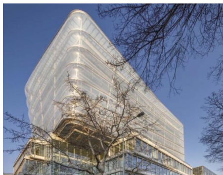
CIIRC metodou BIM

Přestavba a využití BROWNFIELDS v Praze a ČR BIM pro PRŮMYSL 4.0 a zvýšení produktivity práce ve STAVEBNICTVÍ ČR Zařízení pro INTELIGENTNÍ DOMY a DOMÁCNOSTI VÝŠKOVÉ a INTELIGENTNÍ BUDOVY v ČR a EVROPĚ