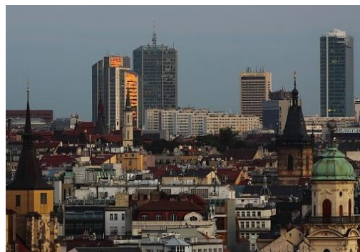
Nové výškové budovy Praze?