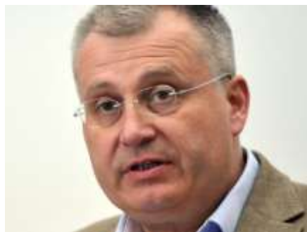
Jiří Nouza, prezident SPS