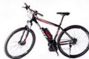
SCOTT e-Aspect 29''