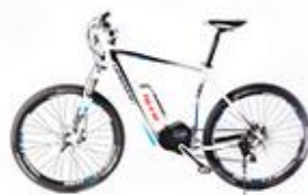
HAIBIKE eQ xDuro RX