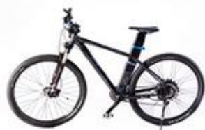
CUBE EPO 29er